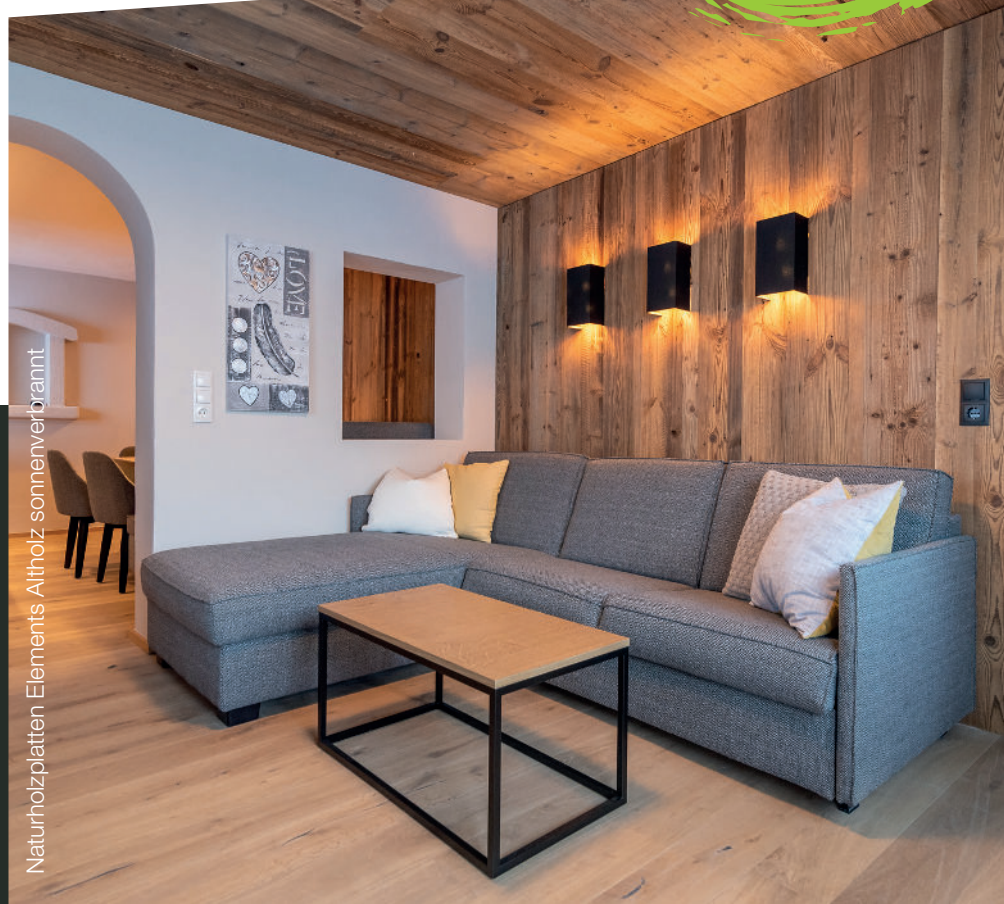
Naturholzplatten Elements Altholz sonnenverbrannt

Raumkonzepte aus Naturholz auf Boden, Wand & Decke