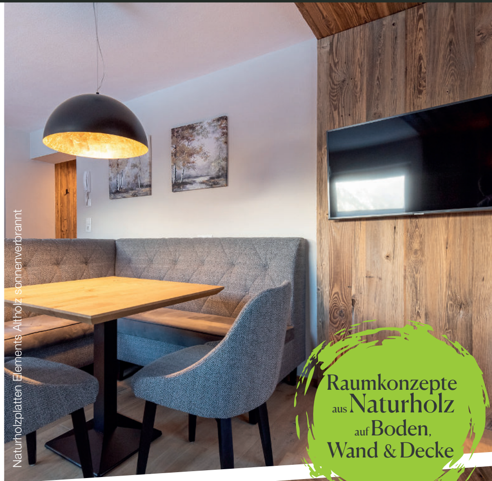
Naturholzplatten Elements Altholz sonnenverbrannt

Raumkonzepte aus Naturholz auf Boden, Wand & Decke